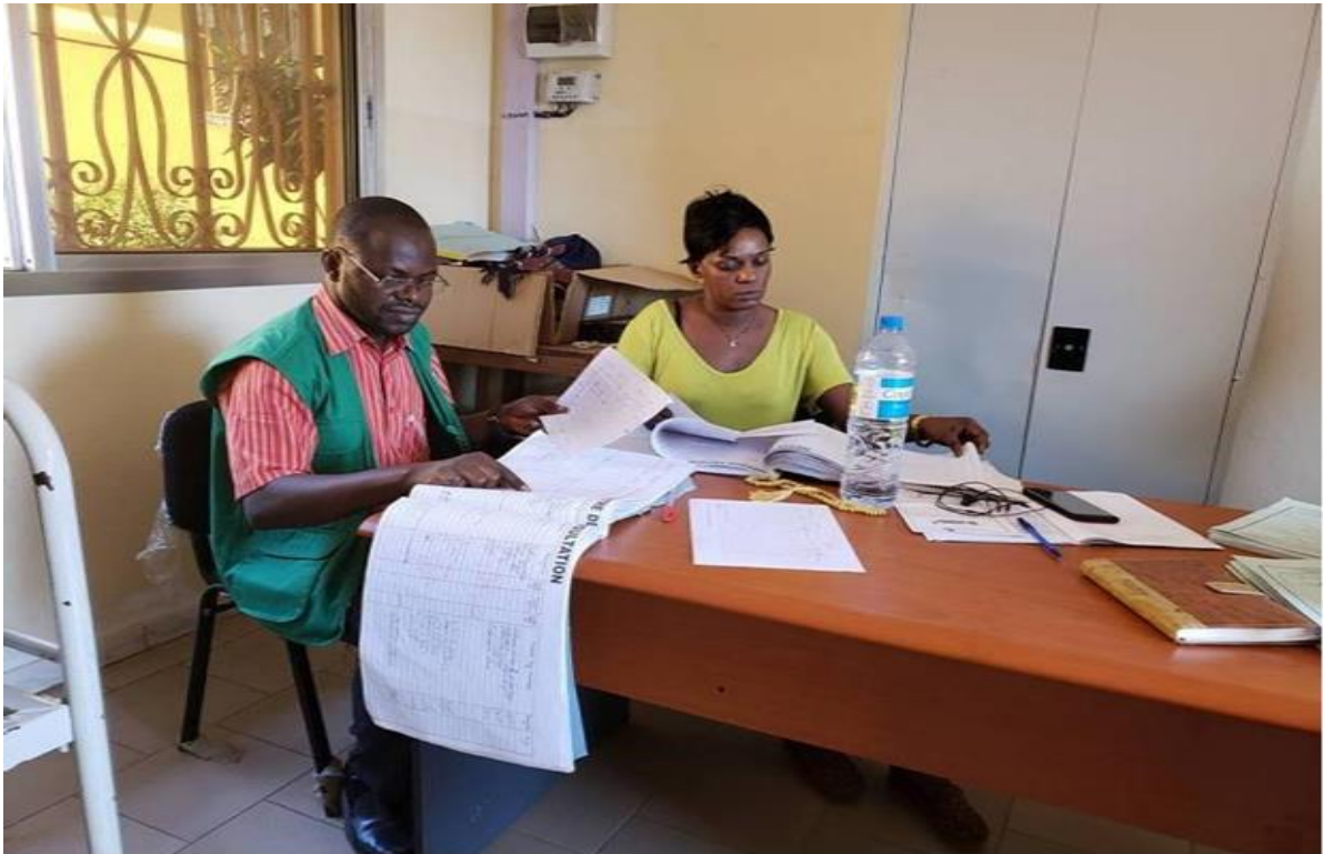
Figure 1 : Revue Documentaire à l'hôpital régional de Mamou