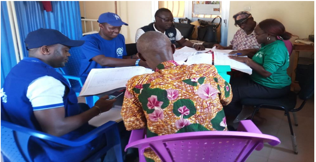
Figure 2 : Revue Documentaire à l'hôpital préfectoral de Kissidougou